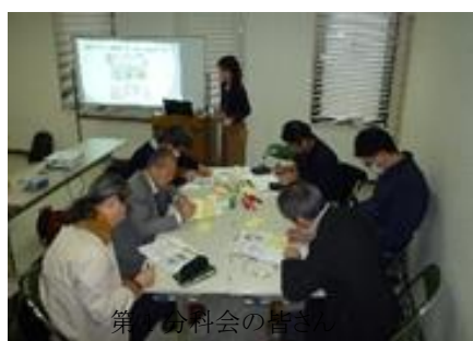
第1分科会の皆さん

現在の日本で起こっている気候変動の影響と行われている適応策について話題提供があり、その後、3グループに分かれて「あなたの考える適応策」のアイデアを出しあい、よいアイデアに投票するグループワークがありました。最後に、各グループで票の多かったアイデアについて分科会全体で共有しました。防止策を実施するような新たな適応ビジネスを展開する等、これまでにないユニークな案が提示されました