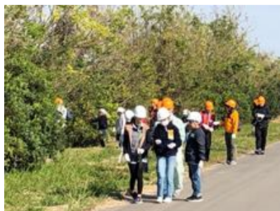
有明海岸の森づくり（緑の少年団の参加）

今後の抱負： 環境行動計画に示されている「低炭素」「自然共生型」「循環型」の社会実現に向け、「SDGs」を前面に打立てて仲間を増やそうと思っています。