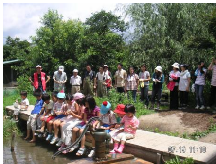
宇美小学校でのビオトープ学習

平成18(2006)年6月から、ビオトープ管理士、環境カウンセラーとしての専門的知識を活かし、ビオトープの維持管理や普及等を通して、生物多様性の重要性の啓蒙を図っている。特定非営利活動法人ふくおか環境カウンセラー協会へ入会後は、環境保全活動を実践するだけでなく、その経験を伝え、環境カウンセラーや環境教育インストラクターなどとして環境保全に関わる人材の育成を積極的に行っている。