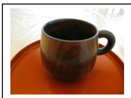
副賞の木製マグカップ