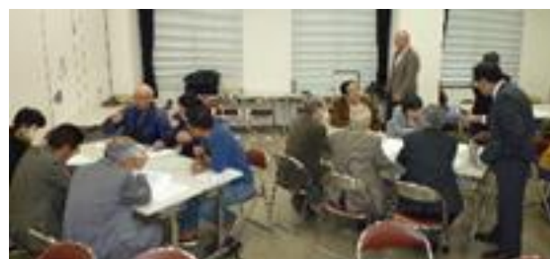
第2分科会の皆さん

それぞれの分科会の報告後、研修は終わり、修了証書が手渡されました。終了後のアンケートによれば、各研修とも、・最新の情報が得られた／・自分の考えもしなかったアイデアを聞くことができた／・ふだんあまり話をしない年令の方や職業の方の意見が聞けた／・分科会の企画が素晴らしかった。次回もして欲しい等の記述が多くみられました。