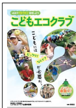
環境省の募集チラシ