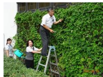
会社での緑のカーテン 7年目

入会動機：佐賀県庁に在籍中は農業土木の技術者として、圃場整備や農地開発など大規模に自然生態系を改変する仕事をやってきました。民間の建設コンサルタントに再就職後は、時間的に余裕もできましたので、生態系の保全や環境保全などのお手伝いをしたいと思っています。