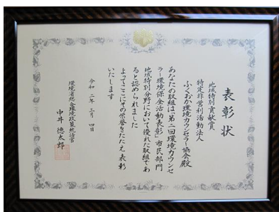
環境省からの表彰状