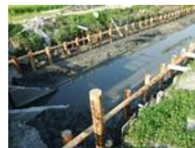
佐賀平野クリーク水路の護岸整備

協会への意見： ビオトープの生態系協会へも参加していますので、お互いに情報の交換ができれば、もっと活動が広がると思います。