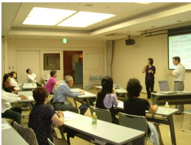
平成22年10月3日粕屋地区「聴覚障害者生活訓練教室」講演